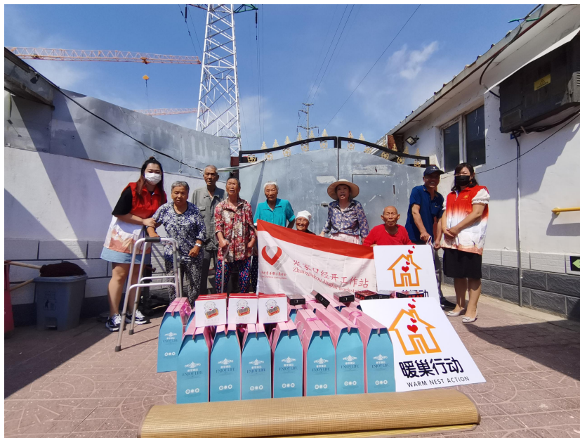
(河北慈善联合基金会-为张家口地区孤困老人发放暖巢礼包)